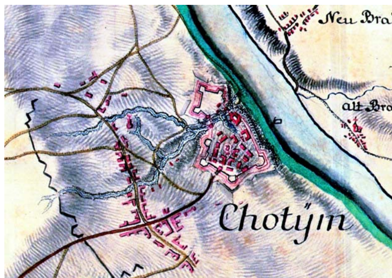
Fig. 2. Detaliu din caroul ( Sectio ) 9, cu planul cetății Hotin.

Toate aceste elemente ne permit să identificăm fortificația ilustrată pe prima pagină a atlasului ca fiind cetatea Hotin, care, de altfel, apare cartografiată și în caroul ( Sectio ) 9 al lucrării (Fig. 2).